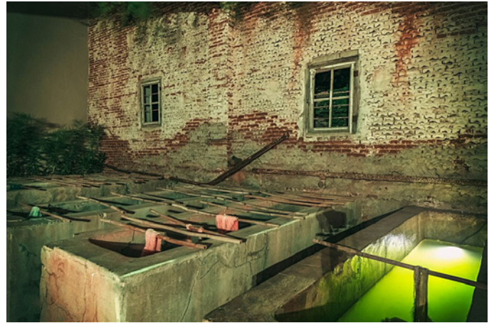
Υπάρχει ακόμη το παλιό βαφείο με τις τιμμεντένιες γούρνες, όπου γινόταν όλη η διαδικασία βαφής με το χέρι

Αυτή ήταν η πρώτη φορά που επισκέφτηκα τον χώρο όπου ο χρόνος είχε σταματήσει πολλά χρόνια πριν και τα σημάδια της εγκατάλειψης ήταν έντονα παντού.