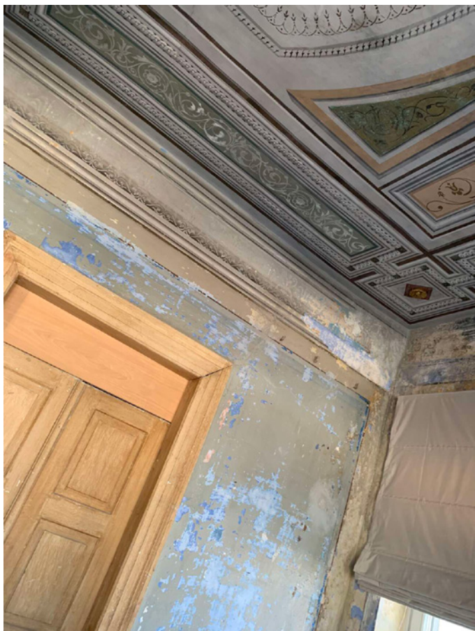
Τα χρόνια του αρχοντικού μετριούνται στα στρώματα των χρωμάτων. Τι ευφυής διακοσμητική προσέγγιση σεβασμού!

Κυρία... Λες και όλες τις άλλες ώρες μιλούσαν... Αχ, βρε γιαγιά! Ανεβραίωυ σκαλοπάτια, βουτάω σε μνήμες και ιδού! Φτάνουμε στον πρώτο όροφο του αρχοντικού όπου θα μέναμε. Και τι ευφυής διακοσμητική αντιμετώπιση! Τα αποτυπώματα του χρόνου, στρώσεις χρωμάτων στους τοίχους που διαδέχονται το ένα το άλλο επέλεξαν για να είναι το κύριο διακοσμητικό στοιχείο. Όλα τα άλλα, τόσο μινιμαλιστικά εκμηδενισμένα, ώστε να αποτίνουν σεβασμό και φόρο τιμής στον χρόνο και μόνο. Το μπαλκόνι κοιτάζει λιμάνι, το παράθυρο τον λόφο με τον ιερό ναό στην κορυφή του και τα σπίτια σκαρφαλώνουν γλυκά.