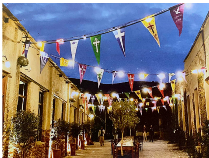
Και «φύσηξε» ζωή στο εγκαταλειμμένο εργοστάσιο. Αρχισε η καρδιά του να χτυπάει! Πόσα ακόμα εργοστάσια περιμένουν μια ευκαιρία!

Πόσα θα είχα χάσει αν δεν τον είχα γνωρίσει! Ο οποίος, συλλέκτης ιδιαίτερος, ξαναβάζει μπροστά τις καρδιές εργοστασίων. Τους δίνει ζωή! Πώς να