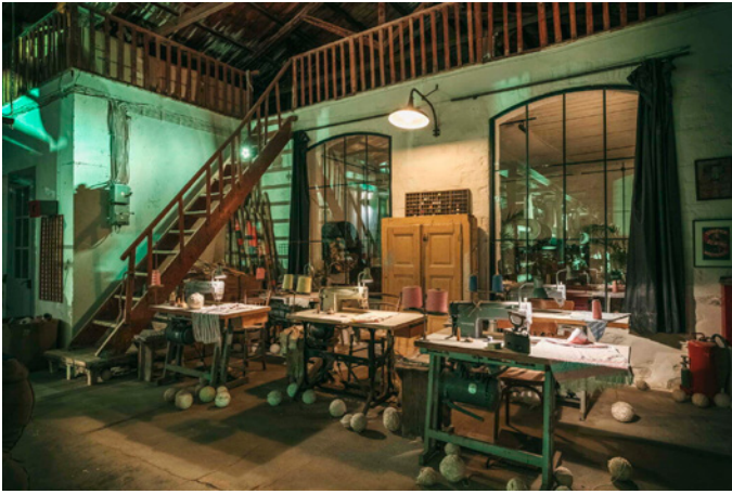
Μηχανήματα και ραπτομηχανές διηγούνται την ιστορία ενός εργοστασίου που ξεκίνησε το 1918 και πάγωσε στον χρόνο το 1986

γράφει εύστοχα και ο Νίκος Δήμου. Πολλά βυρσοδεψεία, βιοτεχνίες και εργοστάσια ερειπώθηκαν. Κάποια από αυτά τα κελύφη ρήμαξαν, τα πιο τυχερά έγιναν εστιατόρια, μπουζούκια και μπαρ. Ήταν σαφές πως οι σύγχρονοι Συριοί είχαν αμχανιά με τα σπαράγματα του παρελθόντος. Οντα του 20ού αιώνα, δεν μπορούσαν εύκολα να χειριστούν το μέγεθος και την πολυπλοκότητά τους αλλά και το οικονομικό βάρος της αποκατάστασης. Και αν τα σπίτια σιγά σιγά αγοράστηκαν από Αθηναίους και συμπονετικούς ξένους ή έγιναν ξενοδοχεία και Airbnb, η βιομηχανική Σύρα παρέμεινε σκοτισμένη, θαμμένη, ξεχασμένη, πέραν του Βιομηχανικού Μουσείου Ερμούπολης.