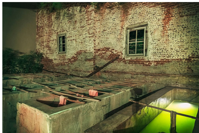
Υπάρχει ακόμη το παλιό βαφείο με τις τιμμεντένιες γούρνες, όπου γινόταν όλη η διαδικασία βαφής με το χέρι

Αυτή ήταν η πρώτη φορά που επισκέφτηκα τον χώρο όπου ο χρόνος είχε σταματήσει πολλά χρόνια πριν και τα σημάδια της εγκατάλειψης ήταν έντονα παντού.