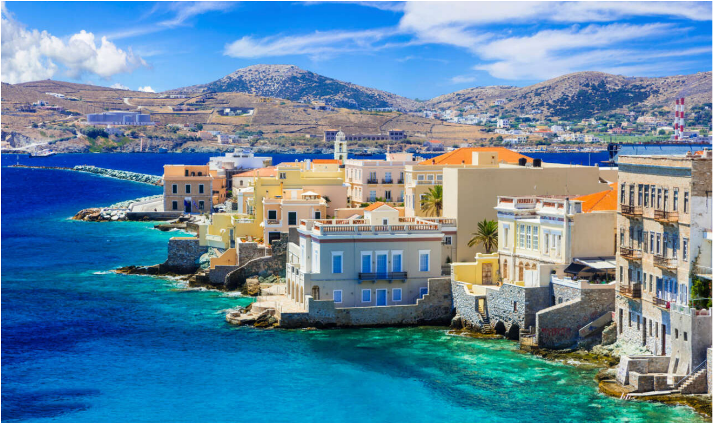
Η «Μικρή Βενετία» της πανέμορφης Ερμούπολης