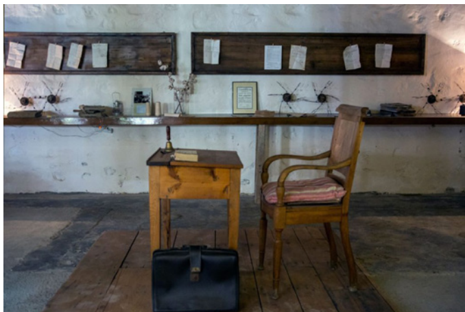
Η κλωστές που φτιάχτηκαν εκεί συνεχίζουν να κεντούν το σήμερα, με άλλον τρόπο

γάζωμα στις ραπτομηχανές ήταν οι ήχοι που στη φαντασία μου συμπλήρωναν το σκηνικό, αφού δεν ακούγονταν πλέον στο χώρο.