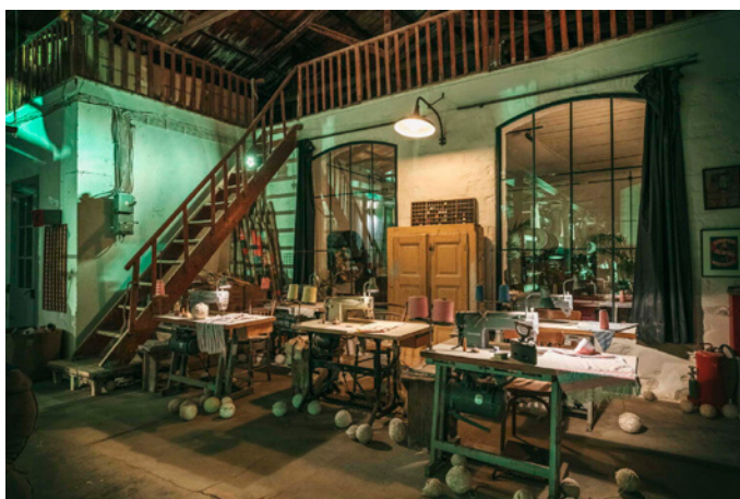
Πατώντας ανάμεσα σε μπάζα, σπασμένα δοκάρια, μεταλλικά κουτιά με επιγραφές και κουτσουλιές από περιστέρια έβλεπα παντού μια εικόνα εγκατάλειψης

Πατώντας προσεκτικά ανάμεσα σε μπάζα, σπασμένα δοκάρια, μεταλλικά κουτιά με επιγραφές και κουτσουλιές από περιστέρια έβλεπα παντού μια εικόνα εγκατάλειψης. Αφού διασχίσαμε περίπου τριάντα μέτρα, βρεθήκαμε σε μία μεγάλη πόρτα που προς μεγάλη μας έκπληξη δεν ήταν καν κλειδωμένη. Ακολουθούσα τον φίλο μου κατά πόδας και κοιτούσα γύρω χωρίς να μιλώ και προσπαθώντας να καταλάβω. Μετά από λίγο άλλη μια πόρτα βρέθηκε μπροστά μας. Τρεις πόρτες ανοίξαμε συνολικά και ξαφνικά βρεθήκαμε σε έναν μεγάλο χώρο. Η πρώτη εικόνα που θυμάμαι είναι ένα εγκαταλελειμμένο κτήριο, πολύ μεγάλα, τεράστια μηχανήματα με κάτι σαν κλωστές, λουλούδια που είχαν φυτρώσει στο πάτωμα ανάμεσά τους, σκόνη παντού και ιστοί από αράχνες. Ξαφνικά ένιωσα ότι είχα μεταφερθεί σε ένα άλλο μέρος και πως είχα ταξιδέψει στο χρόνο. Μετά από μερικά δευτερόλεπτα είχα ήδη καταλάβει. «Μάλλον πρόκειται για ένα παλιό κι ερειπωμένο εργοστάσιο», σκέφτηκα, αλλά δεν μπορούσα να καταλάβω τι ήταν όλα αυτά τα μηχανήματα. Είναι ένα παλιό εργοστάσιο Κλωστοϋφαντουργίας, μου απάντησε ο Βασίλης, σαν να διάβασε τη σκέψη μου.