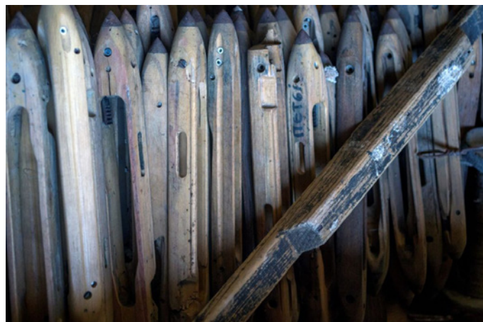
Το έτος 1950 αποτελεί χρονιά κρίσης για την Κλωστοϋφαντουργία της Σύρου © Δημήτρης Καραϊσκος

Το 1932 η εταιρία «Κωνσταντινόπουλος & Ζησιμάτος Ο.Ε.» επεκτείνεται, αγοράζει και το διπλανό κτήριο, παλιό πετρόκτιστο κτίσμα, το οποίο μέχρι τότε χρησιμοποιούνταν ως εργοστάσιο καλεμκερίων (μαντήλια). Η παραγωγική και εμπορική δραστηριότητα της επιχείρησης συνεπώς εστιάζεται στην παραγωγή καλτσών και καλεμκερίων, ενώ σταματάει κατά το Β' Παγκόσμιο Πόλεμο για να συνεχίσει με πολλές δυσκολίες, λόγω των καταστροφών, μετά τη λήξη αυτού. Το έτος 1950 αποτελεί χρονιά κρίσης για την Κλωστοϋφαντουργία της Σύρου και συμφωνείται μεταξύ των δύο συνεταίρων ο διαχωρισμός των επιχειρήσεων μετά της κινητής και ακίνητης περιουσίας. Την περίοδο που συμφωνήθηκε ο διαχωρισμός στο εργοστάσιο απασχολούνταν 57 μόνιμοι υπάλληλοι πέραν των συνεταίρων.